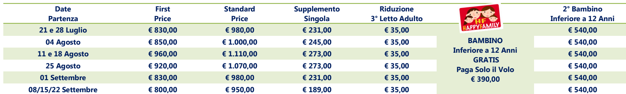
Tabella Prezzi Harem Junior Suite

Quota per persona in camera doppia - Trattamento ALL INCLUSIVE - Volo da CATANIA + Soggiorno + Trasferimenti - Supplementi e Riduzioni per persona