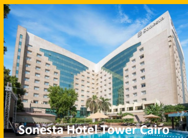
Sonesta Hotel Tower Cairo